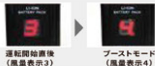
運転開始直後 (風量表示3)