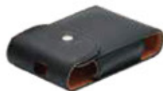
④ バッテリーケース×1個